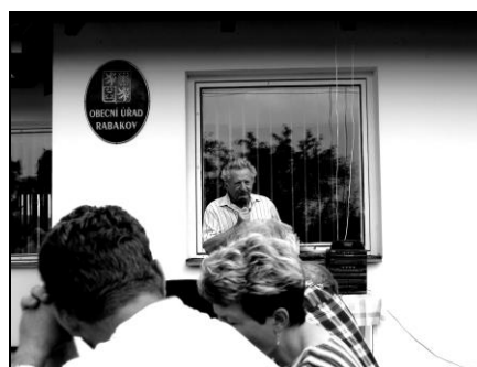
místostarosta při projevu