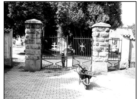
starosta při opravě hřbitovní brány