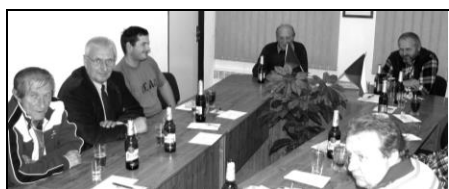
Ze zasedání obecního zastupitelstva

V tomto roce se konalo 8 veřejných zasedání obecního zastupitelstva. Zastupitelé se na nich zabývali běžnou agendou obce a především těmito úkoly: